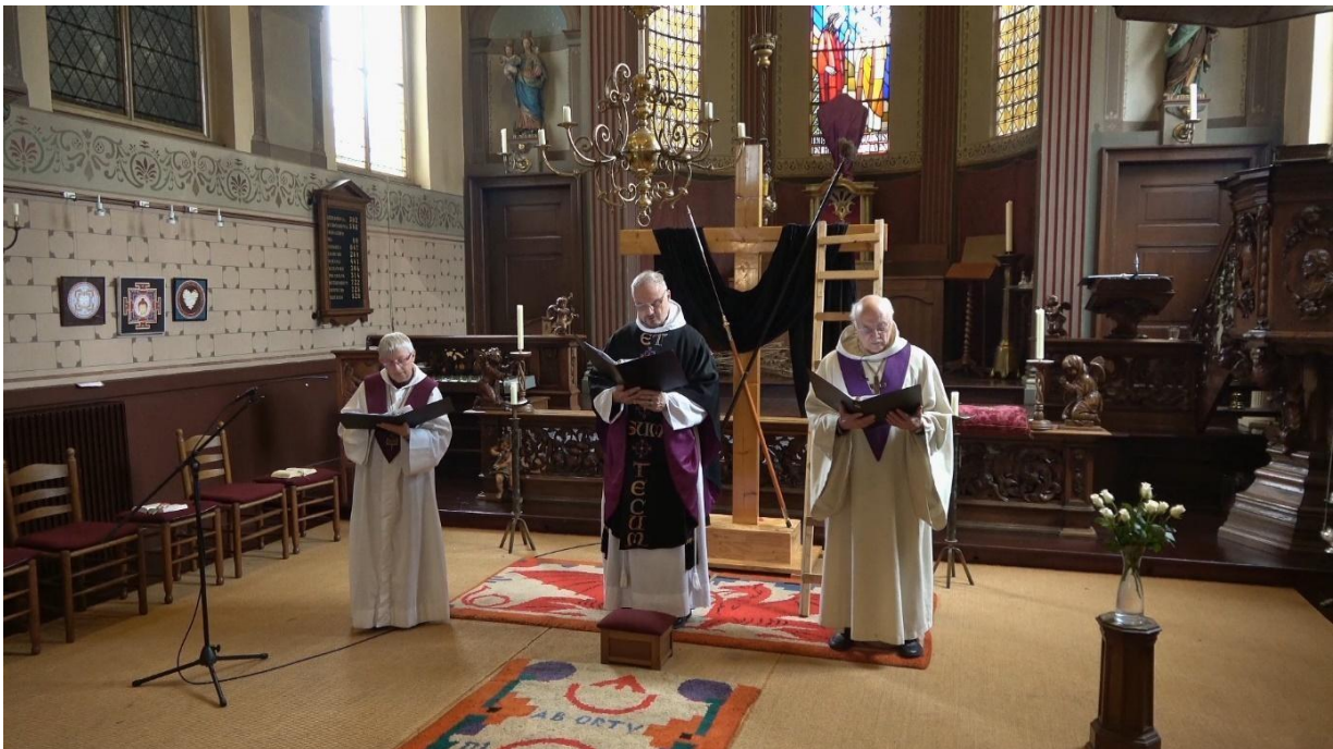
(Tijdens de Kruisverering op Goede Vrijdag wordt uit het Passieverhaal van Johannes gelezen)

Op Goede Vrijdag herdenkt de Kerk dat Jezus aan het kruis stierf. Het wordt in de Kerk herdacht tijdens een dienst van het woord. Tijdens deze viering staan fragmenten uit het lijdensverhaal centraal die daarna geactualiseerd worden naar het lijden in de wereld van vandaag. De voorbeden in deze moderne viering van Goede Vrijdag staan daar ook bij stil. Er worden bloemen gelegd bij het kruis.