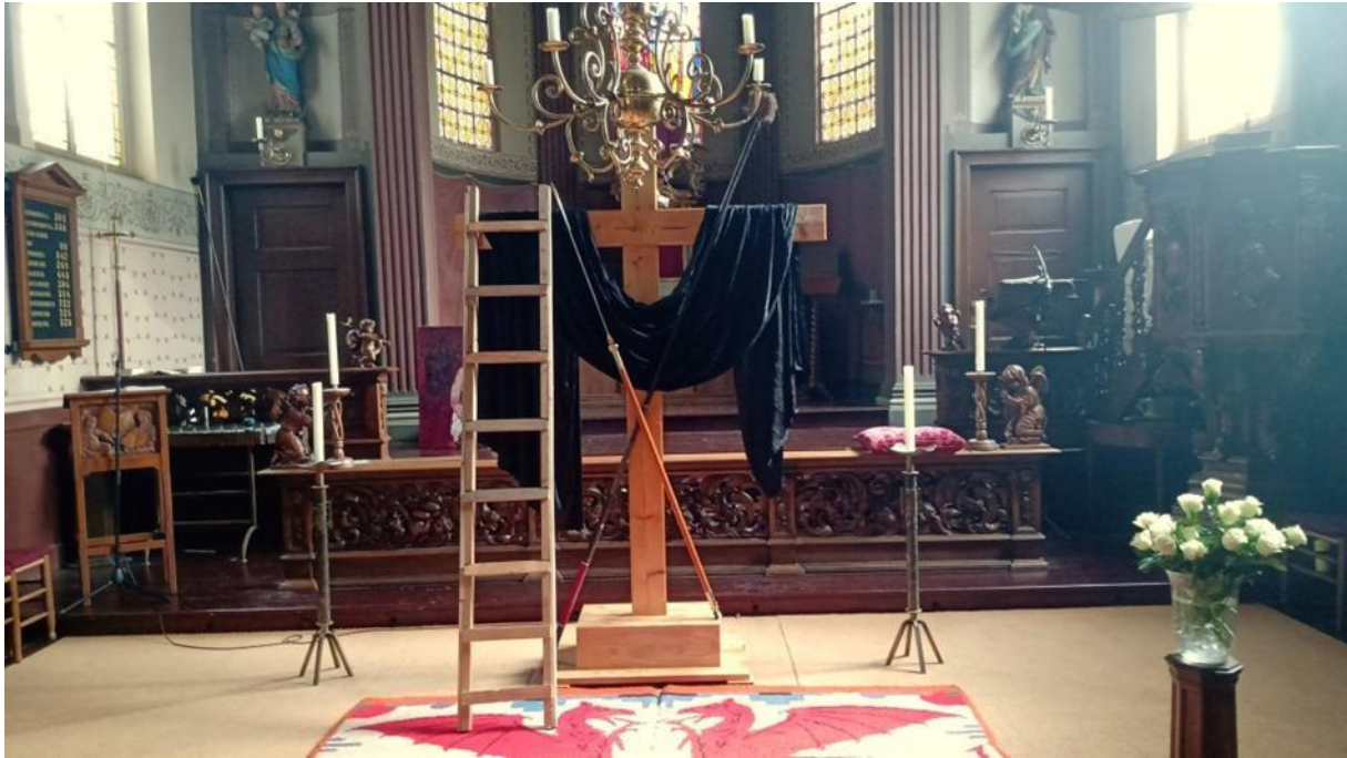
(Goede Vrijdagopstelling in de Oud-Katholieke Kerk voor de Kruisverering)

Op Goede Vrijdag herdenkt de Kerk dat Jezus aan het kruis stierf. Het wordt in de Kerk herdacht tijdens een dienst van het woord. Tijdens deze viering staan fragmenten uit het lijdensverhaal centraal die daarna geactualiseerd worden naar het lijden in de wereld van vandaag. De voorbeden in deze moderne viering van Goede Vrijdag staan daar ook bij stil. Er worden bloemen gelegd bij het kruis.