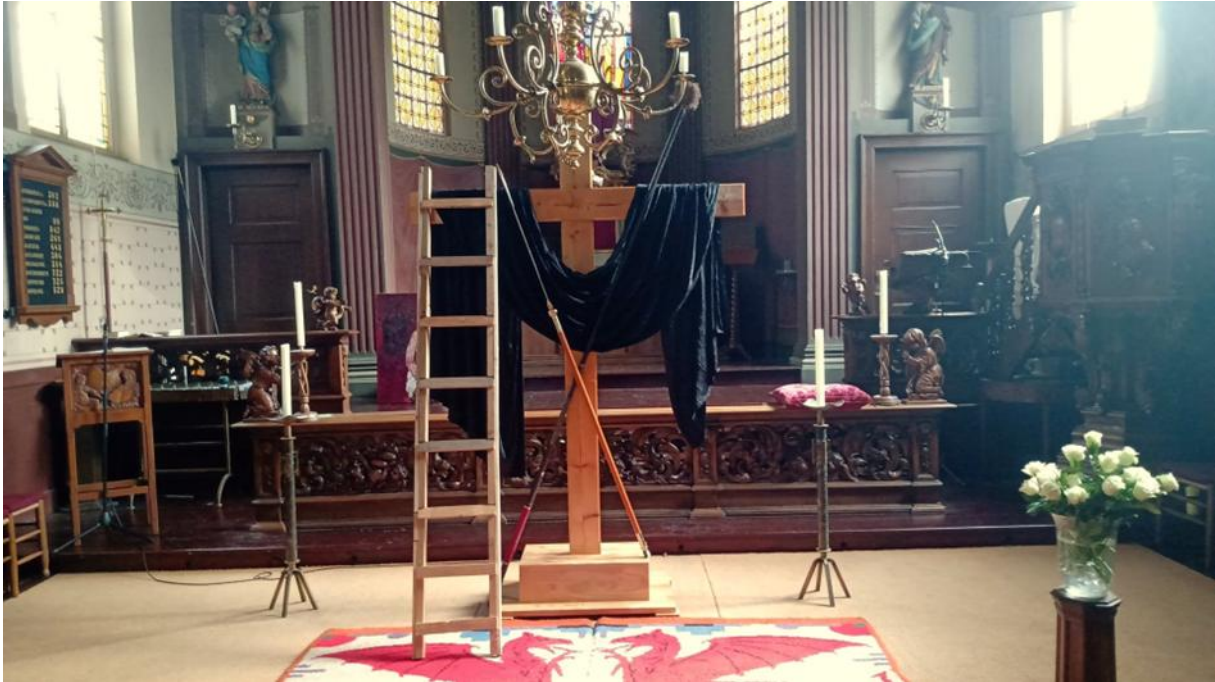
(Goede Vrijdagopstelling in de Oud-Katholieke Kerk voor de Kruisverering)

Op Goede Vrijdag herdenkt de Kerk dat Jezus aan het kruis stierf. Het wordt in de Kerk herdacht tijdens een dienst van het woord. Tijdens deze viering staan fragmenten uit het lijdensverhaal centraal die daarna geactualiseerd worden naar het lijden in de wereld van vandaag. De voorbeden in deze moderne viering van Goede Vrijdag staan daar ook bij stil. Er worden bloemen gelegd bij het kruis.