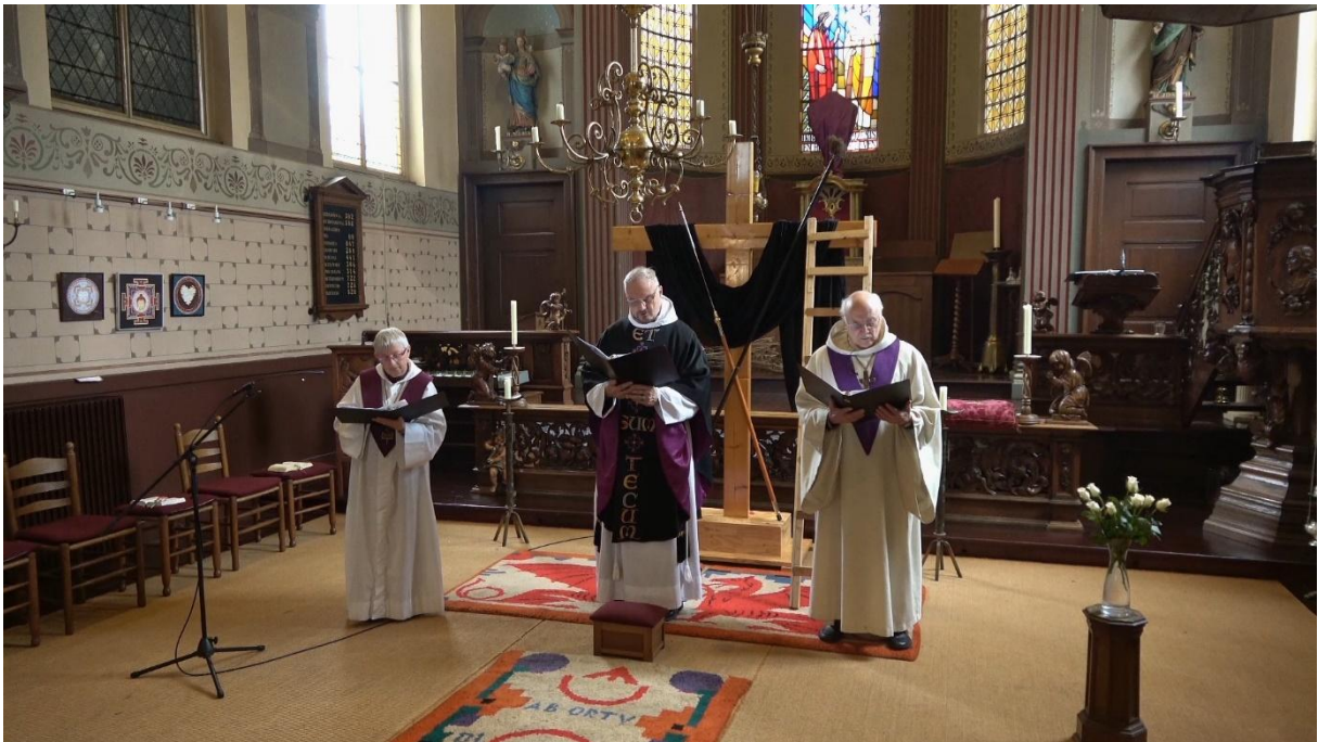
(Tijdens de Kruisverering op Goede Vrijdag wordt uit het Passieverhaal van Johannes gelezen)

Op Goede Vrijdag herdenkt de Kerk dat Jezus aan het kruis stierf. Het wordt in de Kerk herdacht tijdens een dienst van het woord. Tijdens deze viering staan fragmenten uit het lijdensverhaal centraal die daarna geactualiseerd worden naar het lijden in de wereld van vandaag. De voorbeden in deze moderne viering van Goede Vrijdag staan daar ook bij stil. Er worden bloemen gelegd bij het kruis.